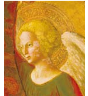
Masolino da Panicale, Madonna and Child with St. Anne (Galleria degli Uffizi, Florence) Enlarged image of the angels on the left and right.

With the latest technology, a new window opens into art appreciation and research. From cracks that have appeared over the years, it is possible to decipher not only the way art pieces have been preserved, but also the drawing techniques that existed at the time.